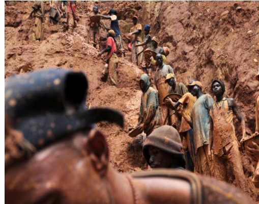
Mines d'or a Sudàfrica