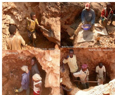
Mines de coltán

Treu el teu mòbil i mira'l atentament. Segur que no saps quina tecnologia té, però que funciona, que el fas servir i que el necessites? Segur que també ignores les contradiccions de tot això!