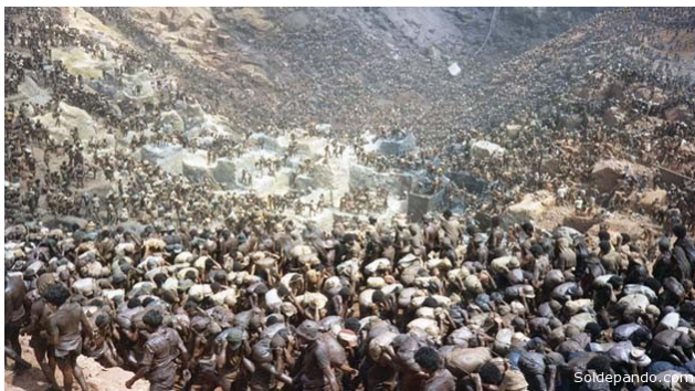
Mines d'or a Garimpeiros, Serra Pelada, Estado do Pará, Brasil