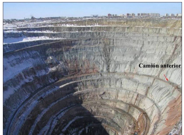
Mirna, Sibèria Central, la mina de diamants més profunda del món