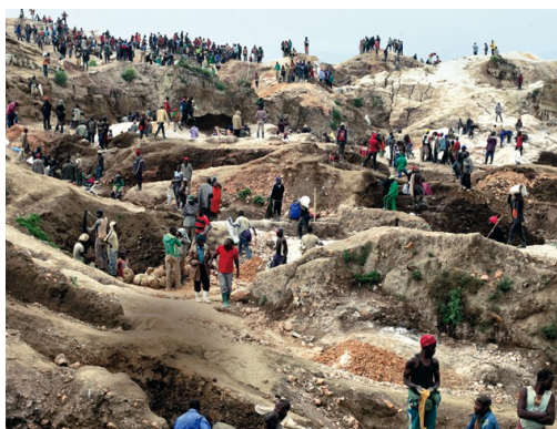
Rubaya, Congo, mines de coltán