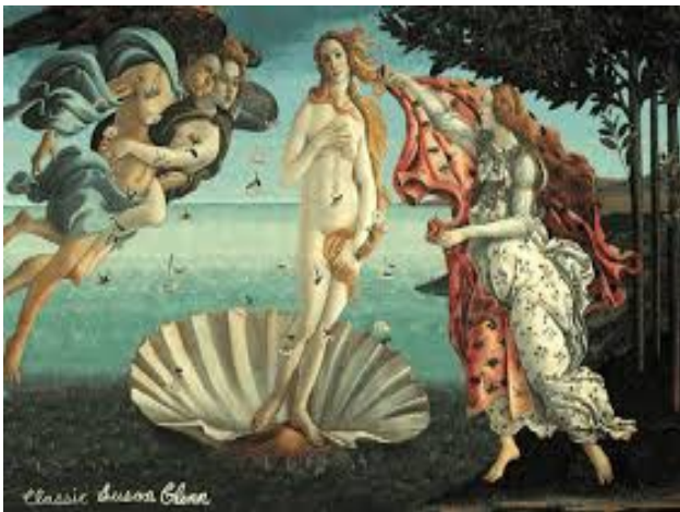
Botticelli: "El naixement de Venus"

2) Per últim, contempleu aquestes imatges i assigneu els conceptes de la lletjor , la bellesa i el sublim a aquelles que correspongui. Digueu el perquè de la vostra elecció.