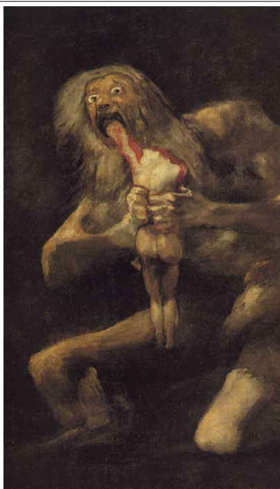
Francisco de Goya: "Saturn devorant un fill"