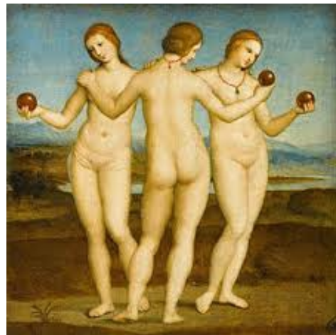
Rafael: "Les gràcies"